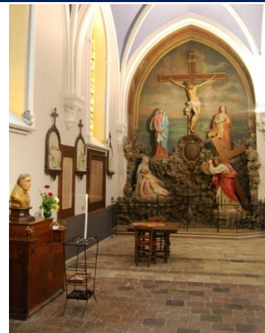
Le grand calvaire, provenant de l'abbaye, avec une fresque peinte en 1913

Le remarquable chœur de l'église mérite toute l'attention du visiteur. Les vitraux représentent (de gauche à droite) le jugement dernier, l'adoration des bergers, la consécration de la paroisse, la cène et le calvaire, avec dans la partie inférieure les blasons et les noms des donateurs. Ces vitraux produisent un effet qui se fait sentir dès l'entrée dans l'église, grâce à leur hauteur, au dessin harmonieux des personnages, et à l'emploi judicieux de couleurs chaudes, le rouge et le jaune, et froides, le bleu. Le plus intéressant est celui du centre, rappelant la consécration au Sacré-Cœur de la paroisse en 1870, où se distinguent la tour de l'église et les ruines de l'ancienne abbaye.