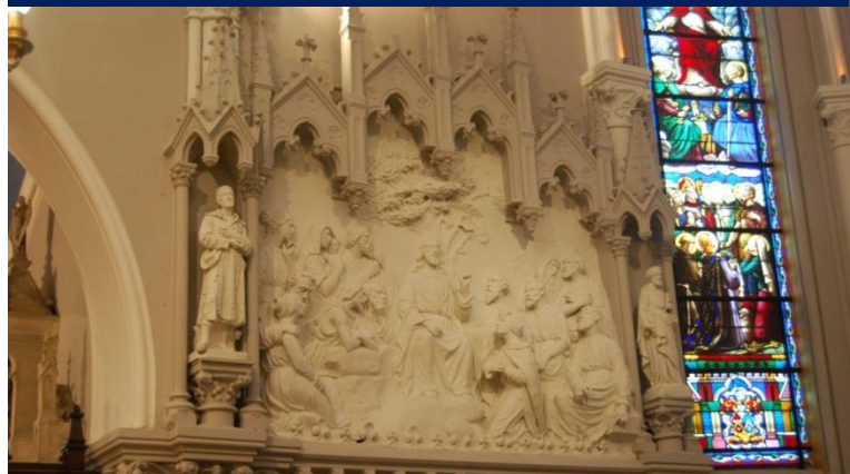
Le sermon sur la montagne, un des deux hauts reliefs du chœur