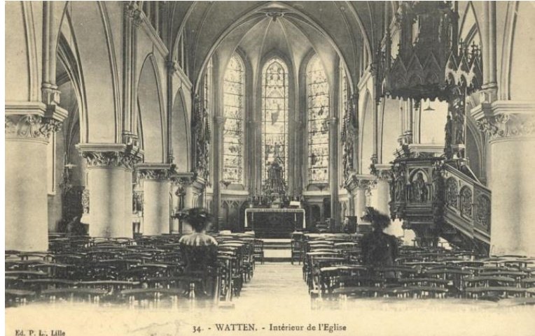
L'église avec son autel issu du noviciat, avant 1920