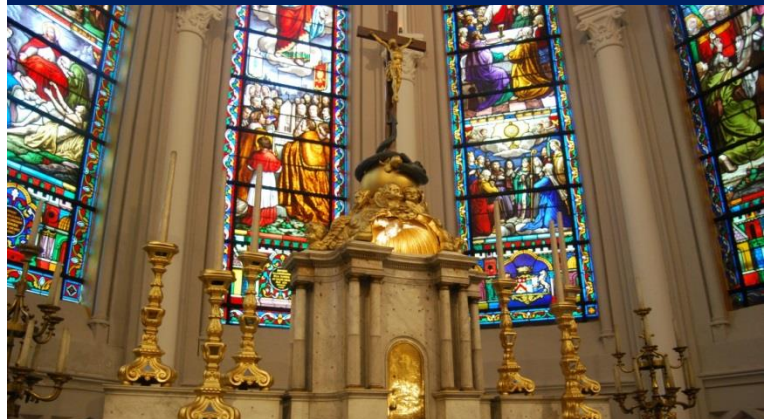
Le chœur de l'église et l'autel actuel