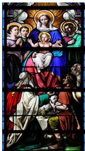
A gauche la consécration de la paroisse, à droite l'adoration des bergers.