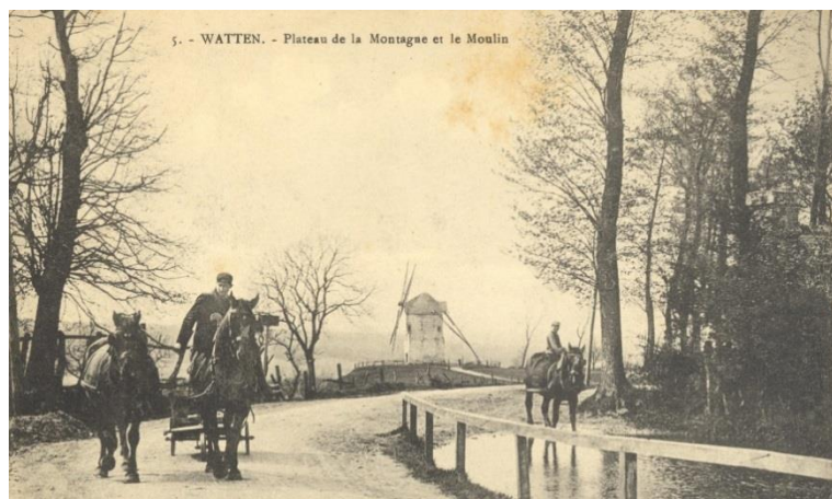
Vue du moulin au début du XXe siècle, avec au premier plan « l'abreuvoir »

diamètre et 28 cm d'épaisseur. Son poids est de 800 kg. Elle est actionnée par le dessous. Il est possible de régler la finesse de la mouture des grains grâce à un système contrepoids écartant plus ou moins les deux meules : c'est la « trempure ». A intervalles réguliers, il faut entretenir les meules qui se polissent avec l'âge : c'est le « rhabillage » des meules, qui consiste à recréer les sillons des meules, avec des outils de « repiquage », mailloche, marteau et boucharde.